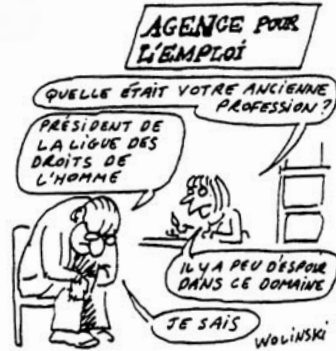
Art. 23 Droit au travail et à un salaire équitable