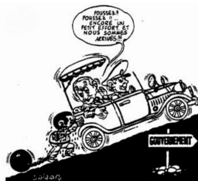
Art. 4 Droit de ne pas être tenu en esclavage