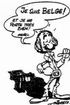
Art. 15 Droit à une nationalité et liberté d'en changer