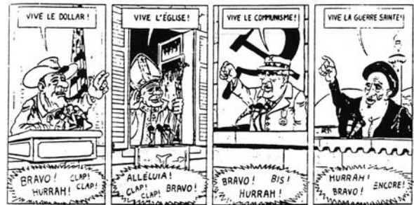
Art. 19 Liberté d'opinion et d'information