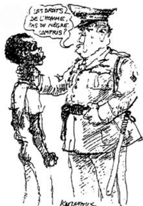
Art. 2 Droits de ne pas subir de discrimination