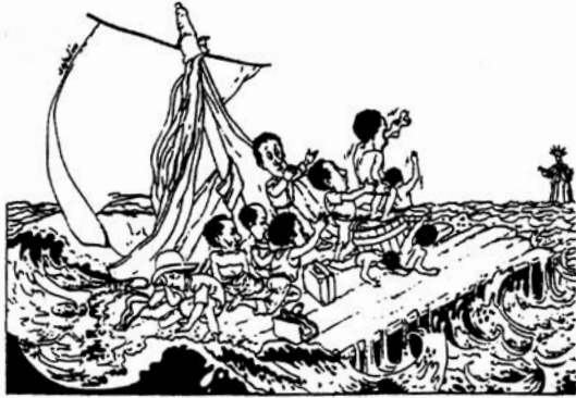
Art. 14 Droit d'asile