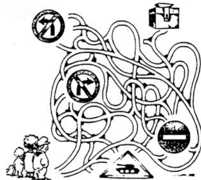
Art. 21 Droit de participer aux élections