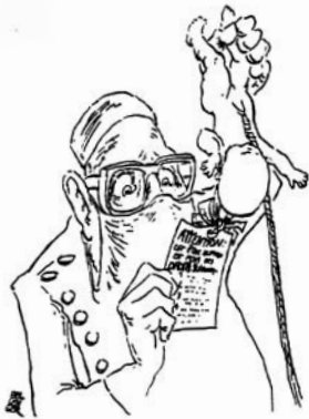
Art. 3 Droit à la vie, à la liberté et à la sûreté de sa personne