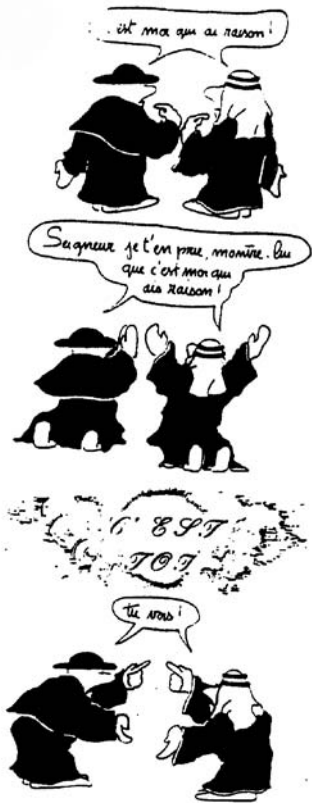
Art. 18 Liberté de pensée et de religion